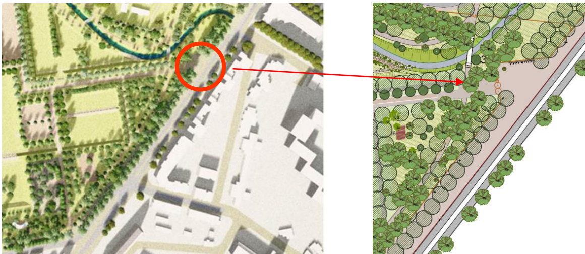
Plan de masse indicatif - Création d'une véritable entrée dans le parc Montcalm depuis l'avenue de Toulouse