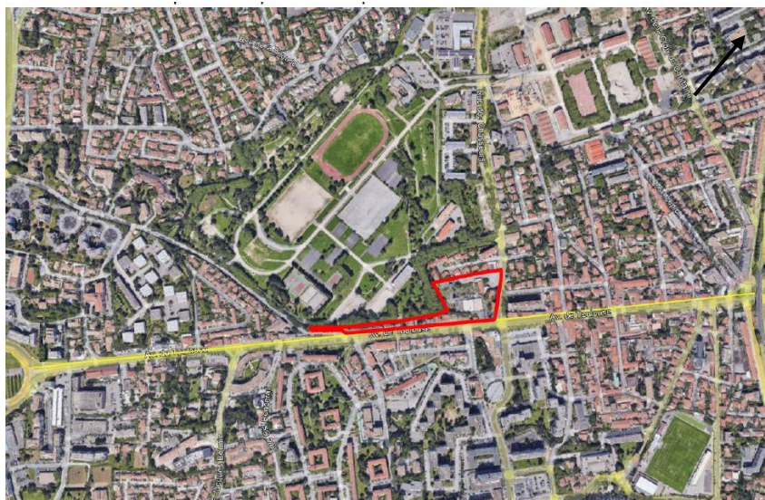
Le Parc Montcalm et l'Avenue de Toulouse

Aujourd'hui, l'emprise foncière de toutes ces différentes parties est inutilisée et clôturée.