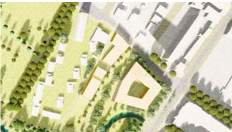
Plan de masse et implantation des constructions indicatifs

Pour la partie la partie située à proximité immédiate du parc Montcalm et du ruisseau du Lantissargues, cette emprise fera l'objet d'une intervention de renaturation, plantation et valorisation de la ripisylve.