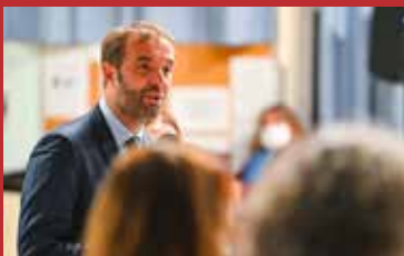
Réunion publique du 31 janvier 2024.

Soyez assurés, à nouveau, de mon engagement pour ce quartier si attachant.»